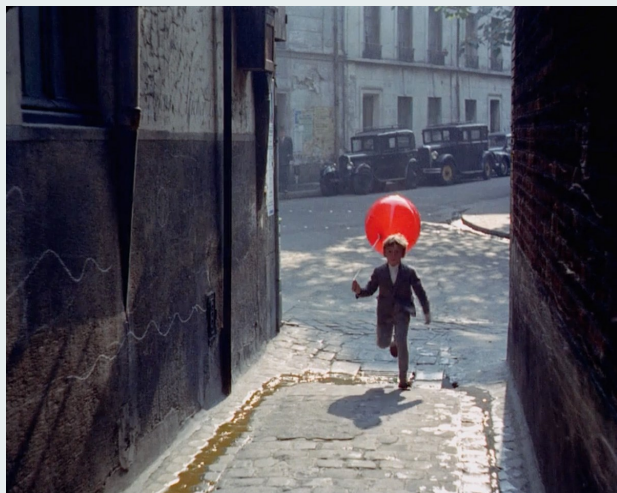
Fotograma de O Balão Vermelho , de Albert Lamorisse