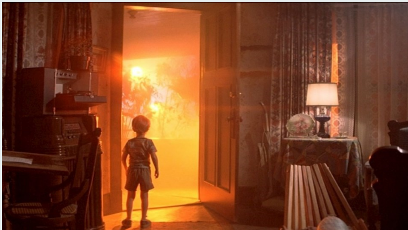
Fotograma de Encontros Imediatos de Terceiro Grau , de Steven Spielberg

A arte do cinema possibilita o acesso a uma ontologia que deve ser considerada basilar no quadro da formação integral dos jovens, quando se perspectiva e defende o desenvolvimento integral da pessoa, o seu direito à liberdade de expressão e à informação, e a qualidade da sua participação em atividades sociais e culturais no quadro da participação de todos na vida cultural. Reflexões internacionais desenvolvidas num quadro europeu valorizam e enquadram globalmente convicções sobre a importância de valorizar o papel do audiovisual, no geral, e o do cinema, em particular, nas práticas desenvolvidas nas escolas e comunidades educativas.