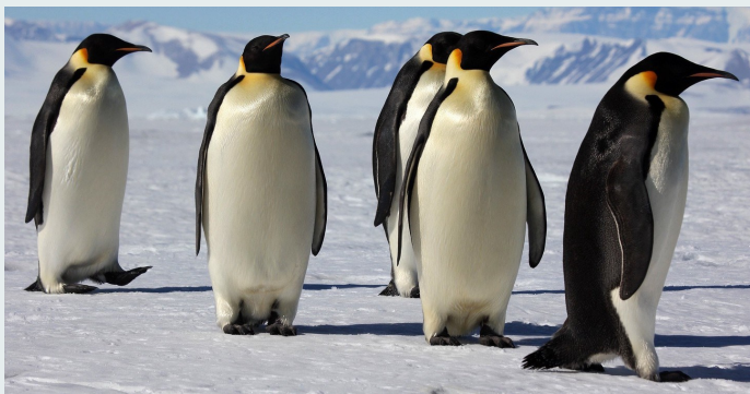
Fotogramas de A Marcha dos Pinguins , de Luc Jacquet