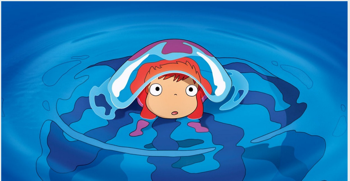
Fotograma de Ponyo à Beira Mar , de Hayao Miyazaki

As equipas do PNC a nível das escolas podem também contactar a coordenação nacional do PNC através do email: pnc@dge.mec.pt