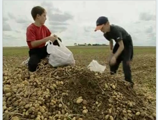
Fotograma de Os Respiçadores e a Respiçadora , de A. Varda

É fulcral que as crianças e os jovens descubram que o cinema é muito mais do que uma forma de entretenimento. Defendemos que os sentidos e a áudio visão das crianças devem ser potenciados através do contacto diversificado com os processos criativos do cinema. As crianças e os jovens devem perceber desde muito cedo que a arte do cinema incorpora métodos de criação próprios, possui códigos específicos que podem ser comentados, aprendidos e praticados, e que a experiência do cinema instaura um lugar de contaminação e reflexão permanente entre as artes, a cultura e as grandes questões civilizacionais.