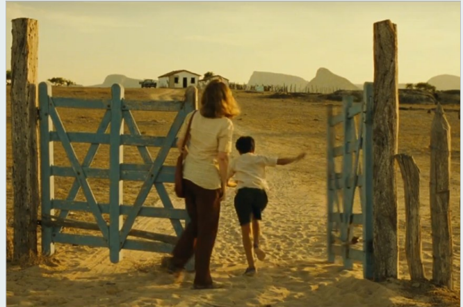
Fotogramas de Mustang , de Deniz Gamze Ergüven; Os Maias , de João Botelho; Com Quase Nada , de Carlos Barroco e M. Cardoso; Central do Brasil , de Walter Salles