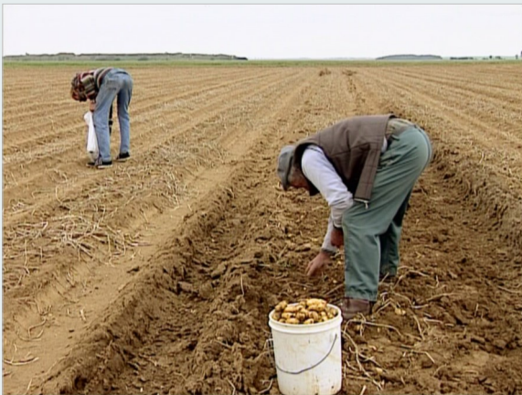
Fotograma de Os Respiadores e a Respiadora , de A. Varda